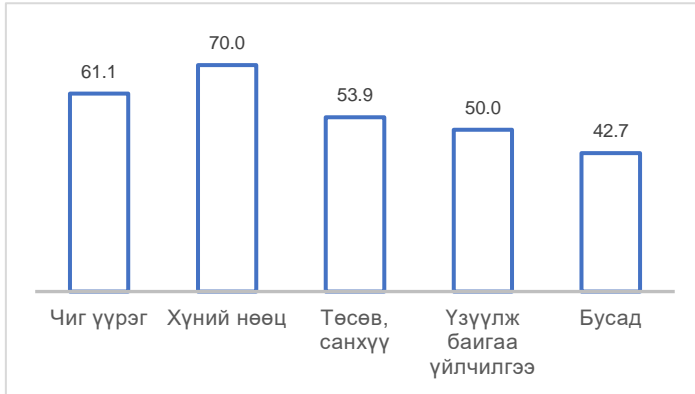
График 1. Мэдээллийн ил тод байдлын үнэлгээ (мэдээллийн төрлөөр)